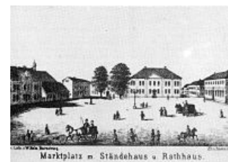
Marktplatz m. Ständehaus u. Rathaus.