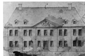
Aufbl. der Regierungsbandel 1728

Eingeweiht wurde nach umfangreichen Sanierungsarbeiten das Alte Kreishaus am Markt. Die Renovierung war nach dem Umzug von Teilen der Kreisverwaltung in das neue Verwaltungsgebäude in der Barlachstraße begonnen worden. Nach Abschluss der Arbeiten erhielten die Parteien des Kreistages hier Fraktionsräume. Die Stiftung Mecklenburg und der Bundesverband der Mecklenburgischen Landsmannschaft zogen ebenso in das Alte Kreishaus ein wie das Kreisarchiv, die Kreismusikschule und die Kreisbildstelle.