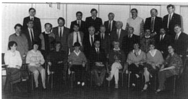
Der Gesamtvorstand des Ratzeburger Sportvereins von 1982 e.V.